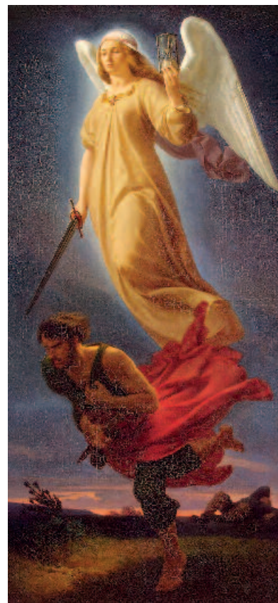
Nemesi, la dea figlia della notte (qui nel dipinto di Alfred Rethel, 1831): malattia-punizione, vindice di colpa presunta, espiazione per maleficio di codardia, eterno conflitto fra desiderio e destino.

Ancora una volta è da sottolineare, in Roth, l'equilibrio tra fascino della narrazione ed universo morale ad essa sotteso. Il titolo di questo romanzo breve, ineccepibilmente costruito per tempi e per scadenze, ci introduce, con determinazione, nella temperie della tragedia greca: il precipitare degli eventi, la disarmata consapevolezza dei personaggi sfidano l'Autore a tessere il filo del suo incandescente confronto con il fato. («... La sua rabbia non era rivolta contro il virus della polio, ma contro la fonte, contro il Dio che aveva creato il virus», pagina 82). Si avvertono echi de «La peste» di Camus e de «La morte a Venezia», così come,